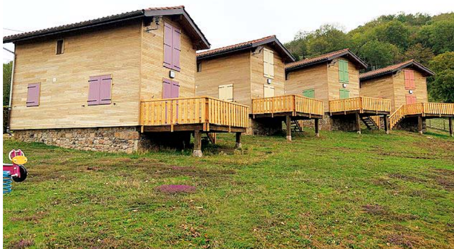
Les gîtes "Priangue" de Saint-Jacques-des-Arrêts.

Les gîtes ont bénéficié d'une rénovation des balustres en mélèze, des volets bois, des façades en bardage bois peuplier thermo-chauffé. Ces travaux ont permis également d'améliorer la performance énergétique avec une isolation en panneaux de laine de bois, le remplacement des menuiseries extérieures en PVC et des convecteurs électriques.