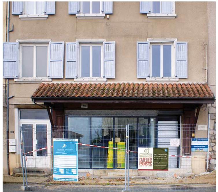
▲ La nouvelle pharmacie en chantier.

Pour tout renseignement, n'hésitez pas à contacter votre Maire délégué ou le secrétariat de la Mairie de Deux-Grosnes. ■