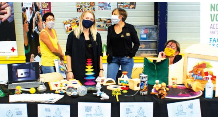
Le stand de la Micro-Crèche de Saint-Mamert lors du forum des associations.

Toutes les personnes intéressées par ce projet sont les bienvenues ! ■