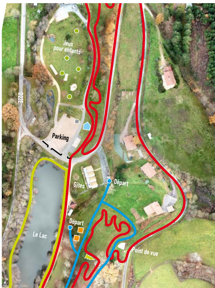
Détail de l'avant-projet de l'aménagement de l'espace de loisirs.

Un parcours santé avec appareils fitness ainsi qu'une piste de cyclo-cross de 2 km pourraient être aménagés sous la tutelle de Christophe Morel, 3 ème au Championnat du Monde de Cyclo-Cross ainsi que d'autres aménagements dont un jeu de boules, la séparation de la route et du parking, un ralentisseur et un point de vue. ■